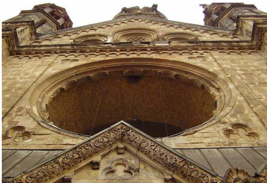
Baranyai Attila németországi fotói