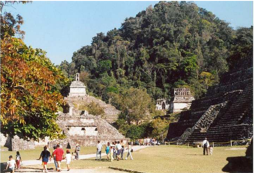
Csőreginé Baranyai Anita mexikói fotói