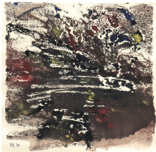
Nagy János: Kozmosz